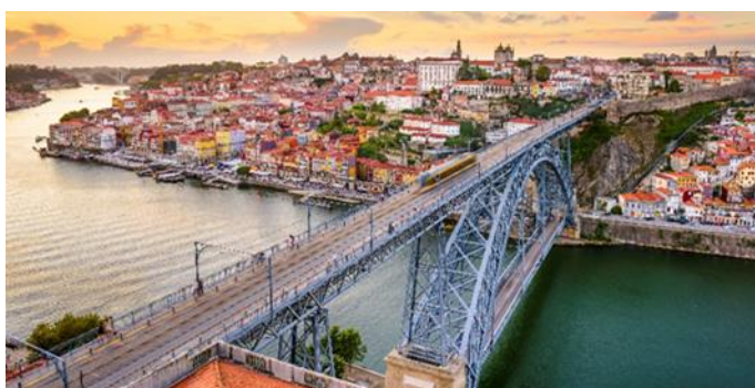
Dom Luis Brücke, Porto