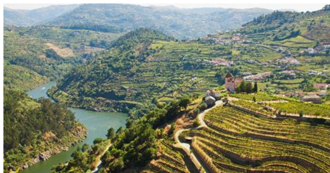
Weinterrassen Douro Tal