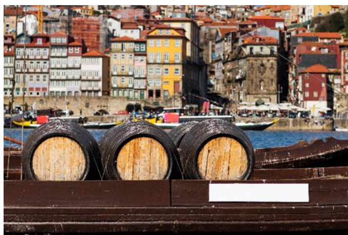
Rabelo Boot, Porto