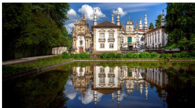
Schloss Mateus, Vila Real