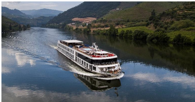
MS Douro Spirit