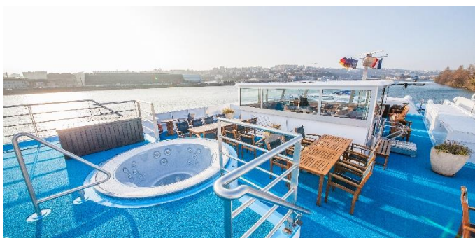
MS Klimt, Sonnendeck