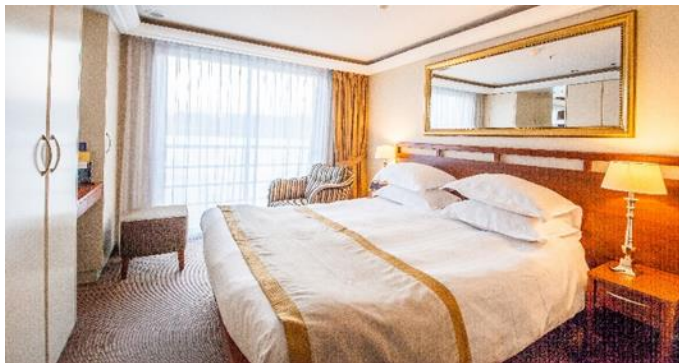
MS Klimt, Doppelkabine Cello- bzw. Violindeck