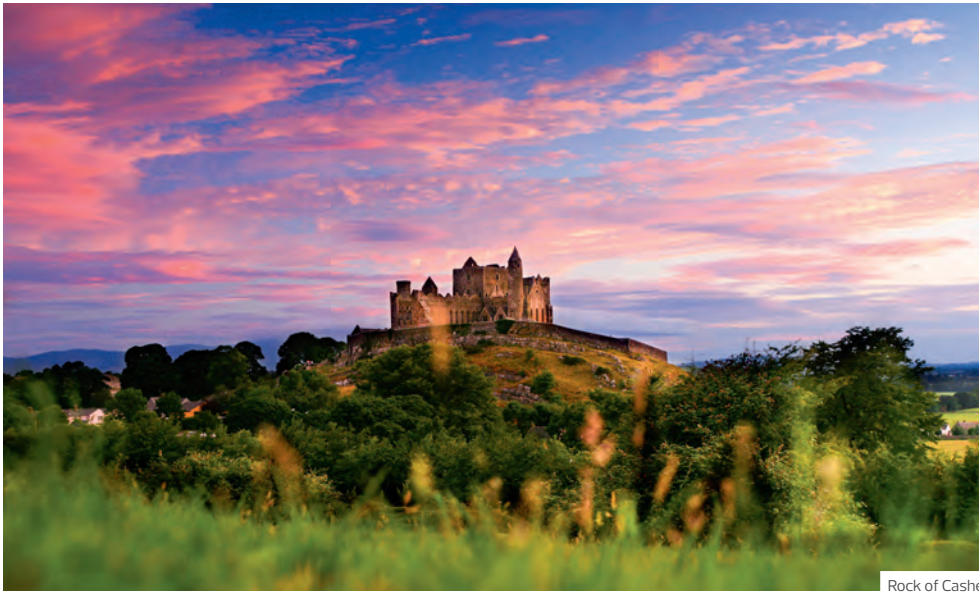
Rock of Cashel