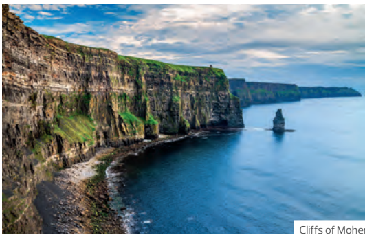
Cliffs of Moher